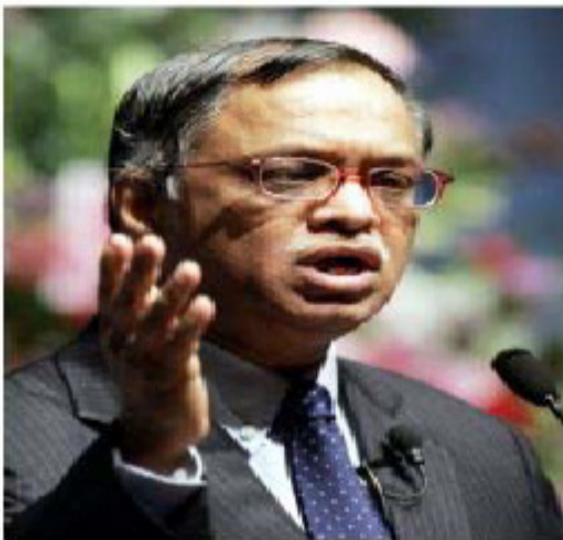
ناراین مورثی - انفوسیس