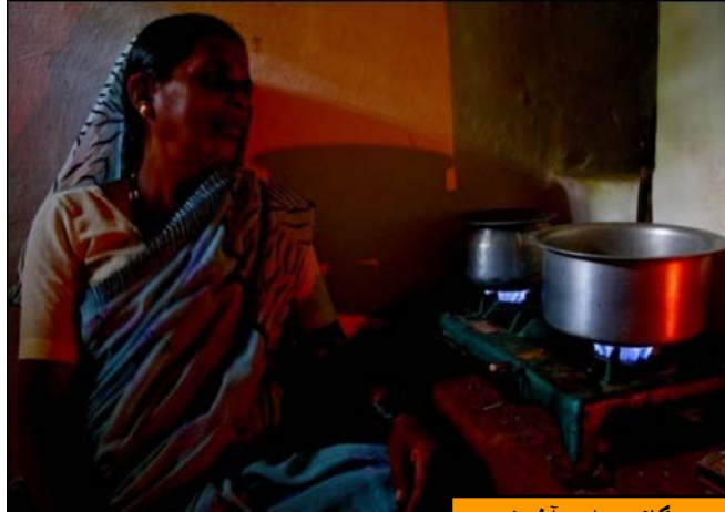
بیوگاز برای آشپزی