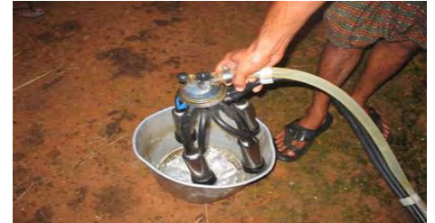
ماشین دوشیدن شیر