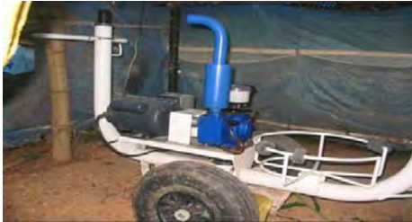
کمپراسور (فشار دهنده)