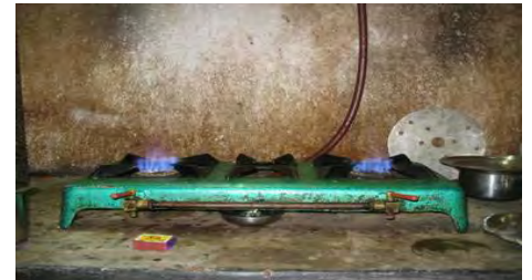
پخت و پز