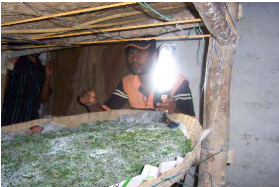
چراغ های آفتابی برای تربیت کرم ابریشم