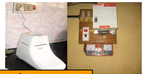
این برق برای منظورهای مختلف در منازل استفاده میشود