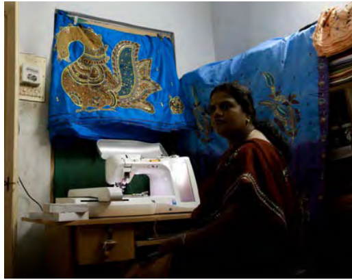
ماشین خیاطی مبنی بر تخصص کمپیوتر در حال استفاده