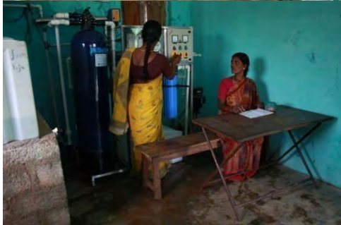
خانم ها دستگاه اس اچ جی را اداره میکنند