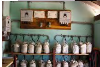
یک کار آفرین در ستیشن چارج کننده بطری آفتابی