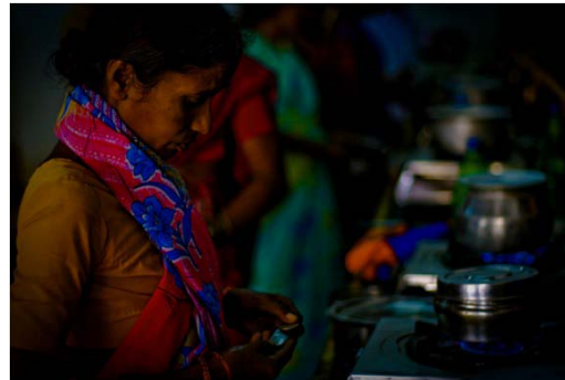
آشپزخانه های عامه