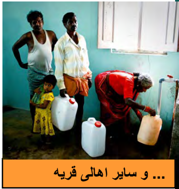
... و سایر اهالی قریه