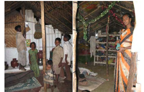
چراغ های ال ای دی برای منازل فقیر