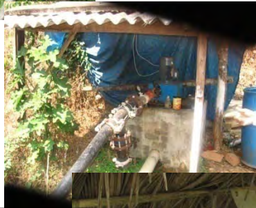
اتاق برای جنراتور