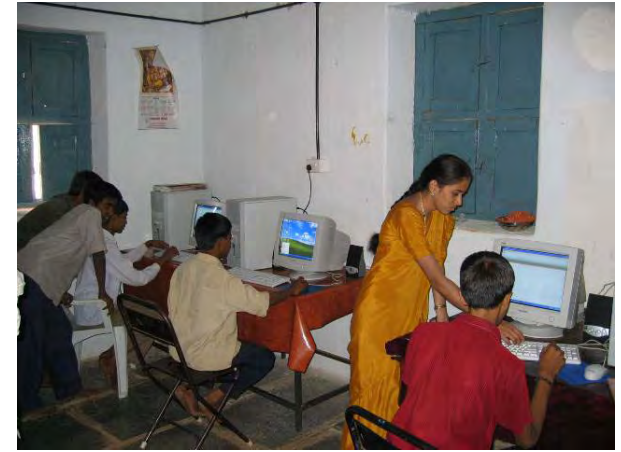
آموزش کمپیوتر در مکاتب