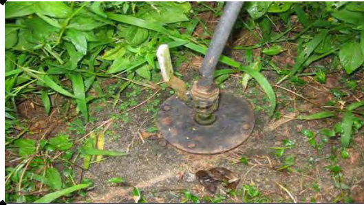
دستگاه بیوگاز (مخرج گاز)