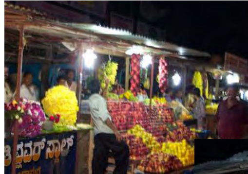
تنویر قابل اطمینان و بهتر برای دست فروشان