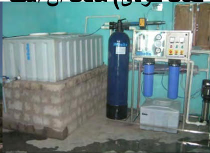
دستگاه تخلص آب آر او