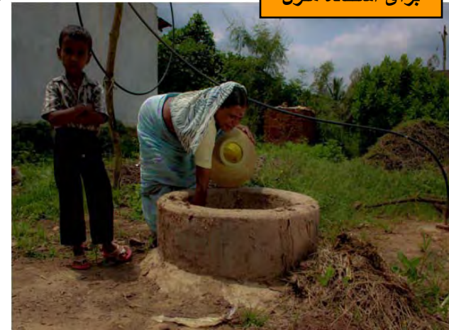
دستگاه بیوماس برای استفاده منزل