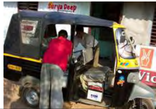
حمل و نقل برای بطری ها